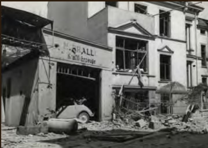
Heinkenstr. 49. Foto vom 08.05.1941