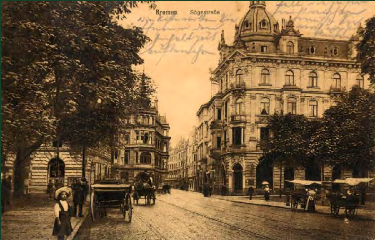
Herdentorsteinweg, Blick Richtung Sögestraße