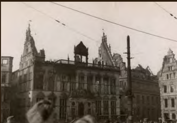
Am Markt (Schütting). Foto vom 13.10.1944

Kameradschaft Verlagsgesellschaft m.b.H Zeitschrift „Die Zivilversorgung“ Comradeship publishing company Magazine „Civil supplies“ 30er Jahre. 30 x 9 cm. Prismenschrift. Katalog-Nummer 550