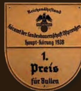
1 st prize for bulls Katalog-Nummer 551

Körämt Ostpreußen Reichsnährstand Blut und Boden Breed Survey Office East Prussia 1938. Ca. 16 x 15 cm.