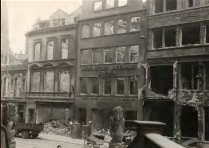
Am Markt 15 - 19. Foto vom 24.10.1944